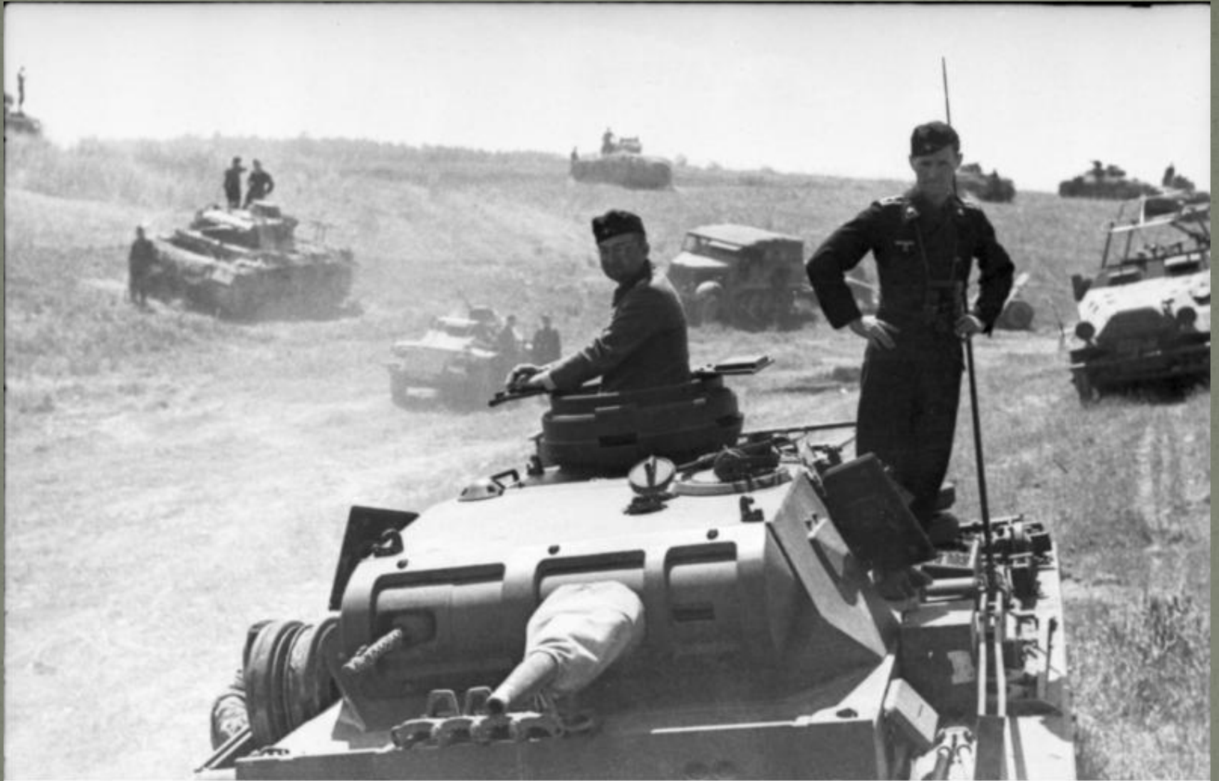
Juni 1941