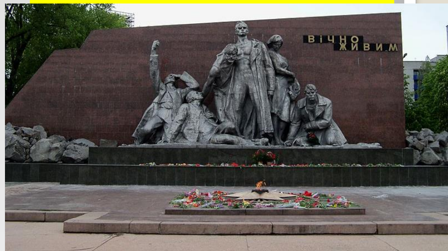
Вічний вогонь у Кременчуці, який символізує вічну пам'ять про загиблих в роки війни