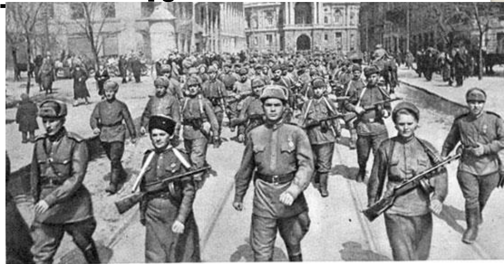
Частини Червоної армії проходять вулицями звільненої Одеси 10 квітня 1944 р.