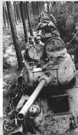
Танки Т-34 Першого Українського фронту в лісі під Берліном. Квітень 1945 року