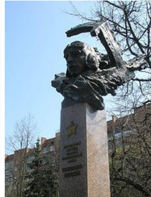
Пам'ятник Катерині Зеленко в Курську