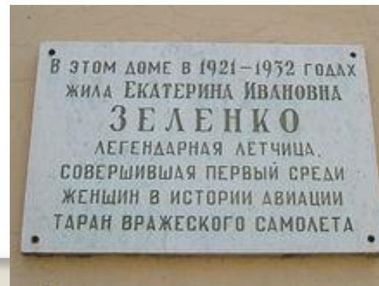
Меморіальна дошка на будинку Катерини Зеленко в Курську