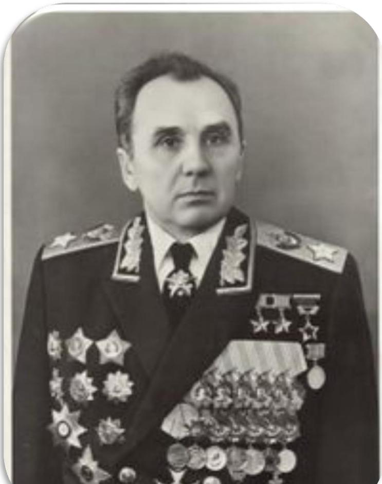
Кирило Москаленко - двічі Герой Радянського Союзу, командувач кінно-механізованої групи Південно-Західного фронту. Народився в с. Гришине, Красноармійського району Донецької області