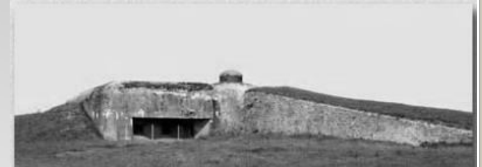
Залишки "Линії Арпада" – ворожих оборонних укріплень у Карпатах