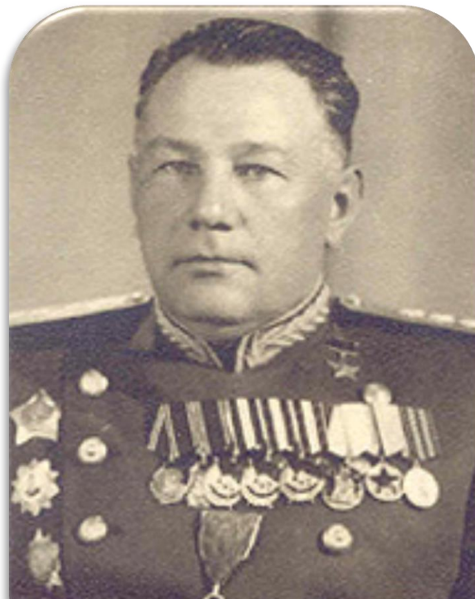
Павло Жмаченко - Герой Радянського Союзу, командувач арміями на 1-му і 2-му Українському фронтах. Народився в с. Могильному (нині село Поліське Коростенського району Житомирської області)