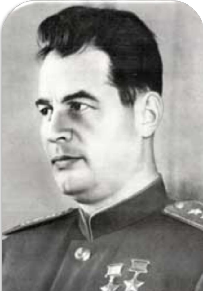
Іван Черняхівський - двічі Герой Радянського Союзу, командувач фронтами. Народився в селі Оксанина (нині Уманського району Черкаської області)