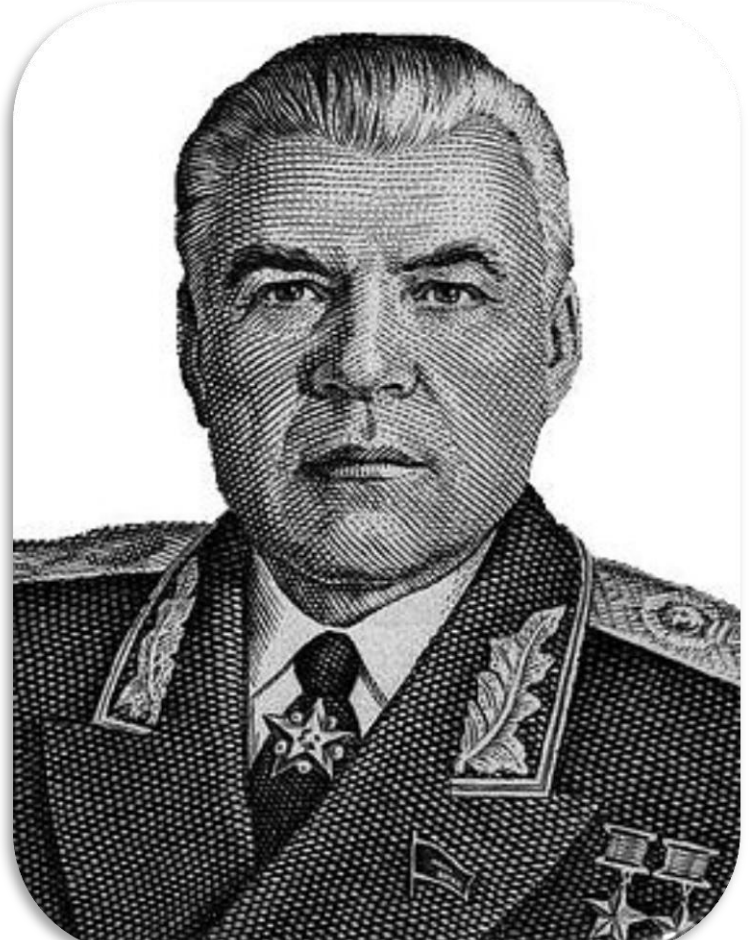
Родіон Малиновський - двічі Герой Радянського Союзу, Народний герой Югославії, кавалер ордена «Перемога». Народився в Одесі