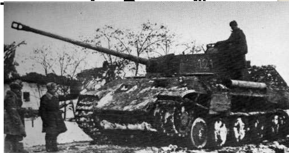
Німецька "Пантера" програла поєдинок з Т-34. Уманська операція