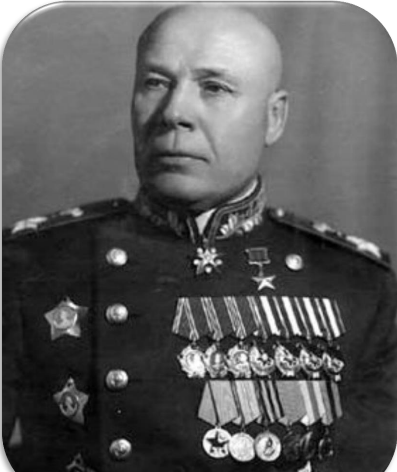
Семен Тимошенко - двічі Герой Радянського Союзу, кавалер ордену Перемога. Народився в селі Фурманівка (тепер Одеської області)