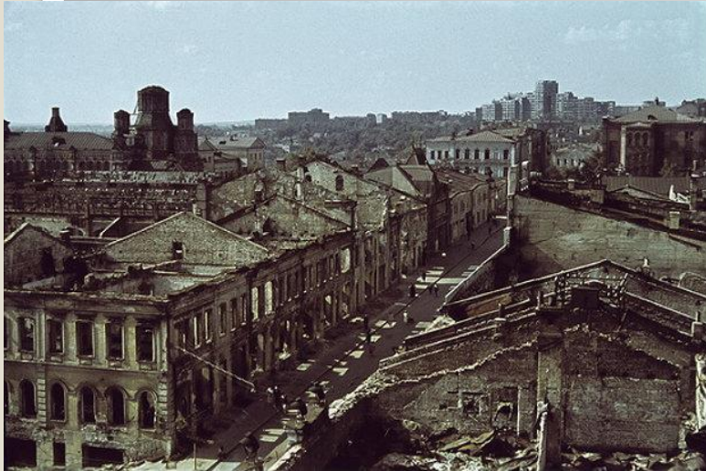
Зруйнований Харків. 1943 рік