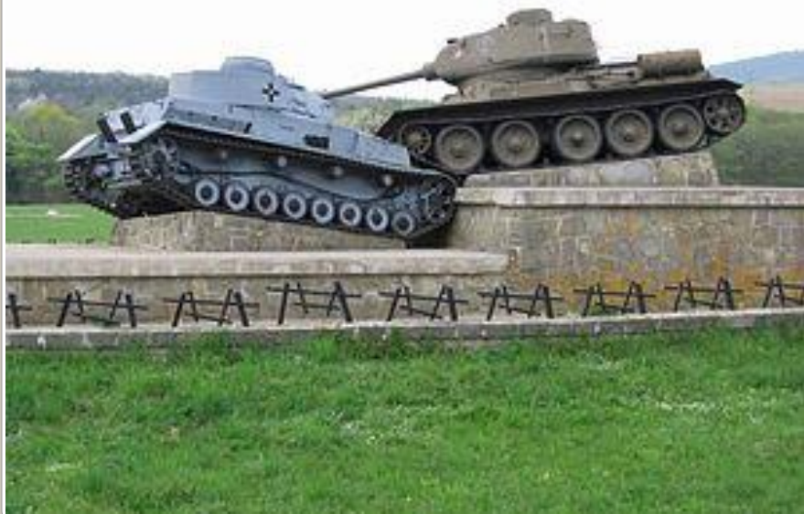
Пам'ятник на місці боїв за перевал Дукля

Суть: завершилося визволення території усієї України у сучасних її кордонах.