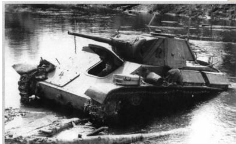
Т-70 форсує річку Уж