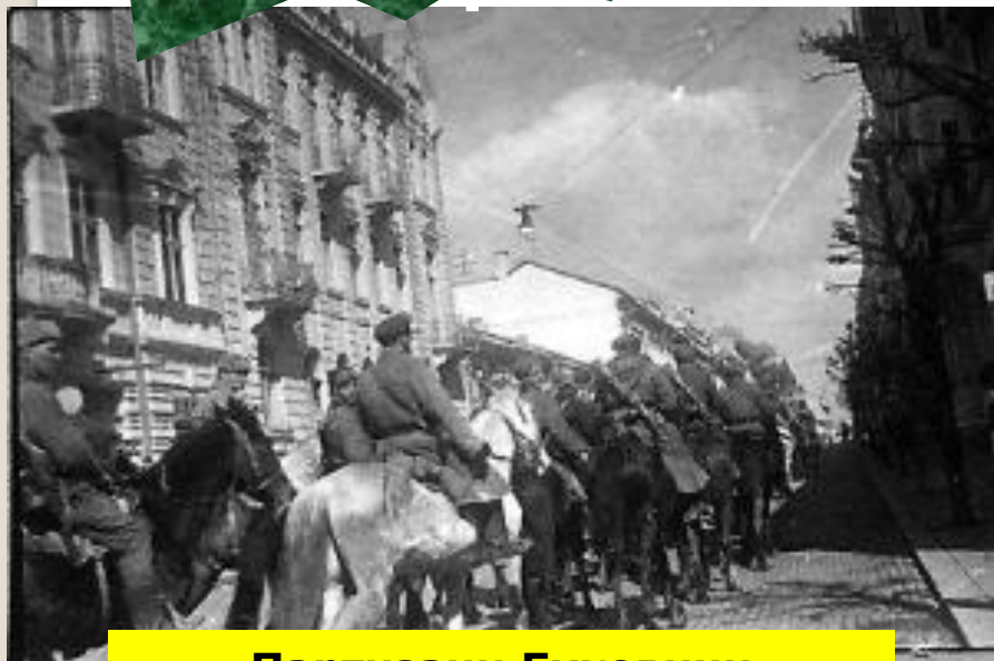
Партизани Буковини повертаються у звільнені Чернівці

Суть: розкол залишків військ ворога на дві частини вихід радянських військ у передгір'я Карпат.