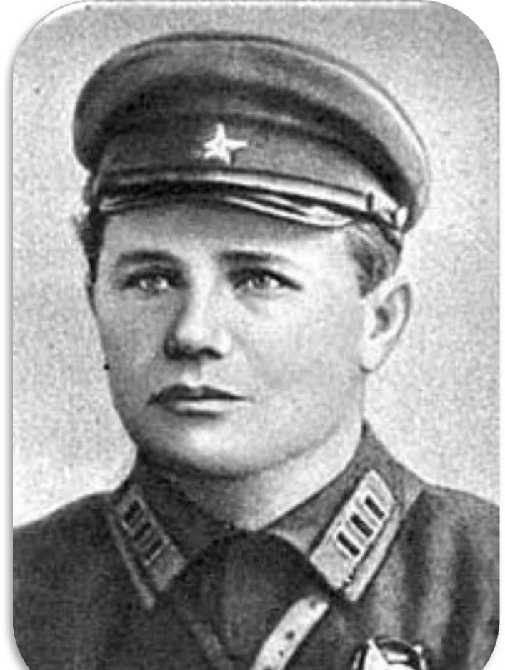
Андрій Єрмоєнко - Герой Радянського Союзу, командувач фронтами. Народився в слободі Марківка, Старобільського повіту Харківської губернії