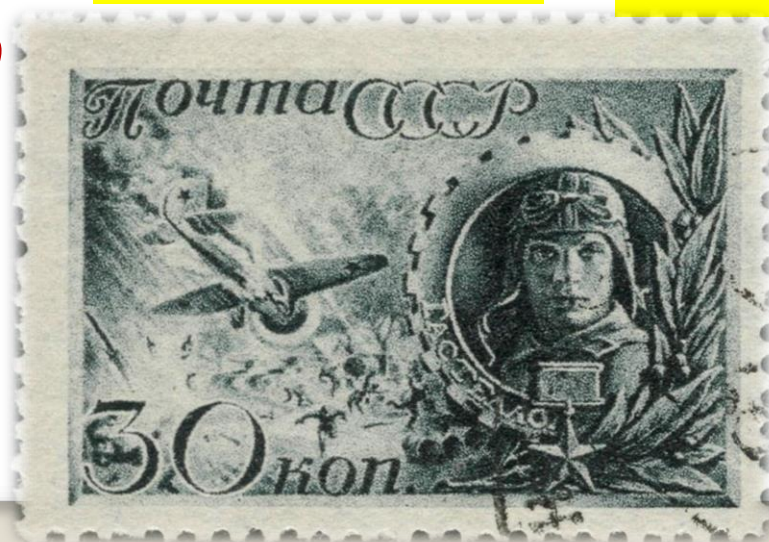
Радянська поштова марка

Миколи Гастелло здійснили таран ворожої техніки на землі.