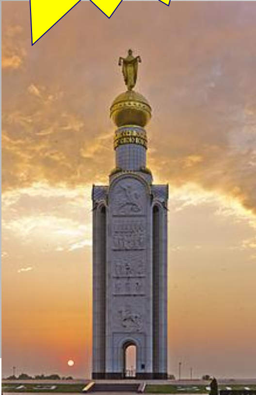
Дзвіниця на честь загиблих на Прохоровому полі