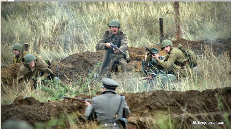
Наступ радянських військ під Мелітополем. Сучасна історична реконструкція