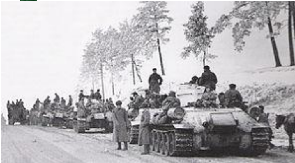
Колона танків Т-34, січень 1944 р.