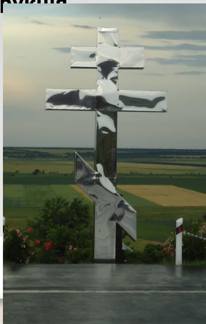
Хрест Меморіалу на Чапаєвських висотах, Запорізька область