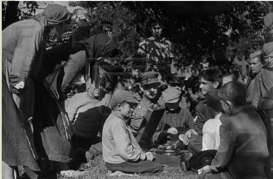
Радянські бійці з мешканцями звільненого села

Суть: вихід до державного кордону СРСР і перенесення бойових дій на