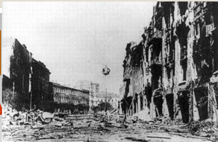
Вигляд зруйнованого Хрещатика