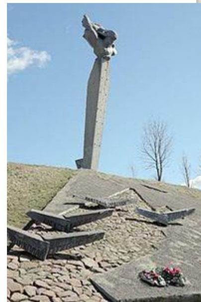
Пам'ятник на місці загибелі літака