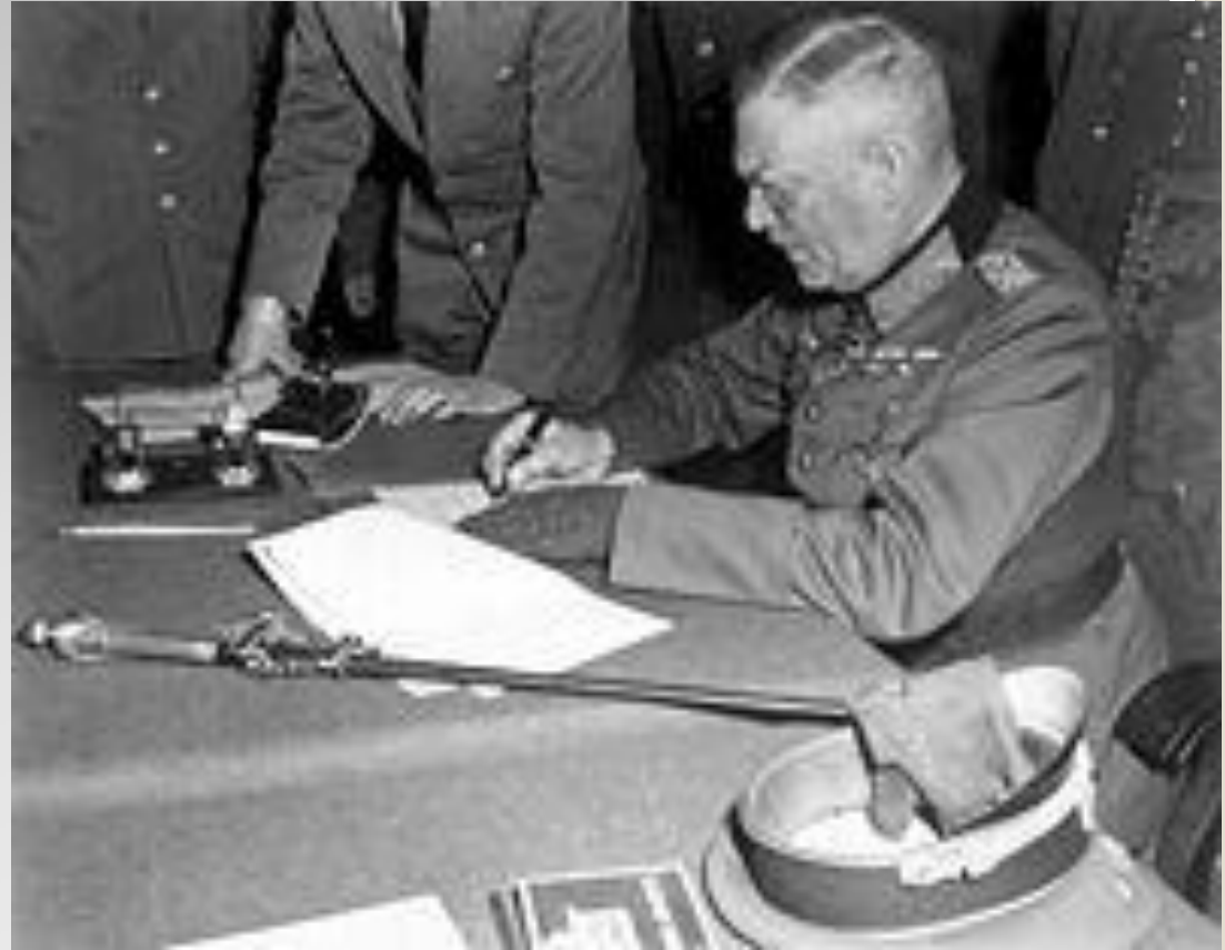
Кейтель підписує капітуляцію в Карлсхорсті