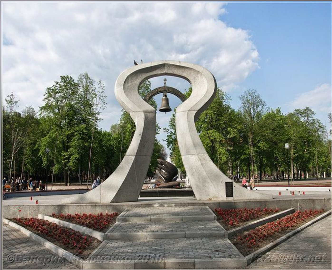
«Чорнобильський дзвін» / Ліквідаторам аварії на ЧАЕС м. Дніпропетровськ